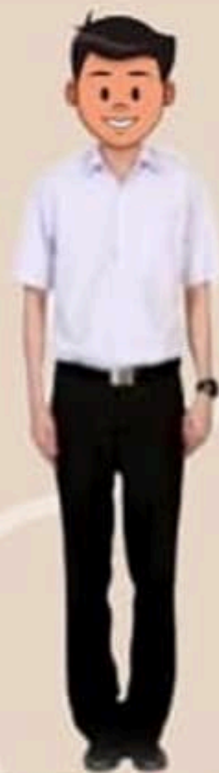
สุภาพบุรุษ