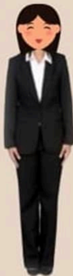
สุภาพสตรี